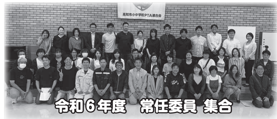
令和6年度 常任委員 集合

※R6年度より総務部からスポーツコミュニケーション部(愛称:スポコミ部)に名称変更いたしました。